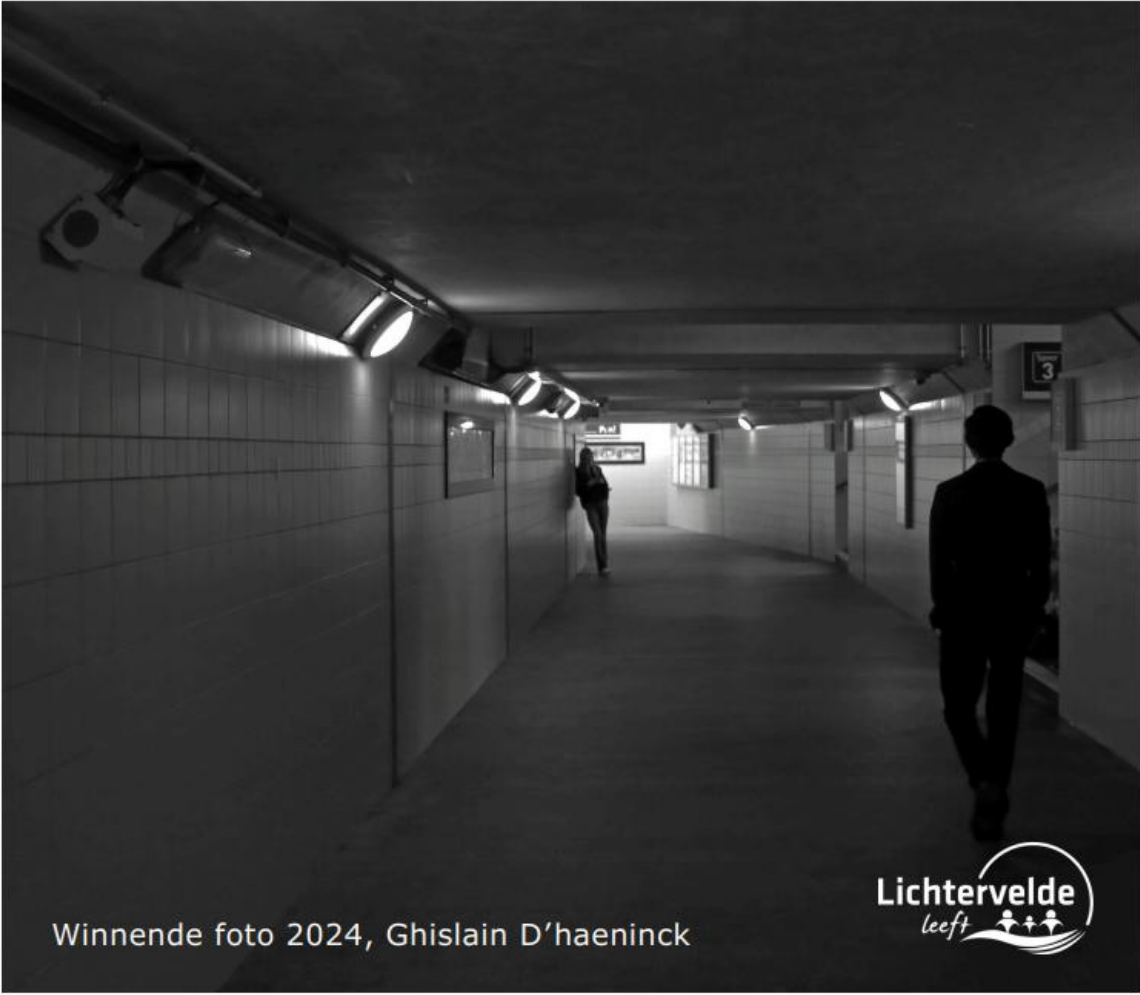
Winnende foto 2024, Ghislain D'haeninck